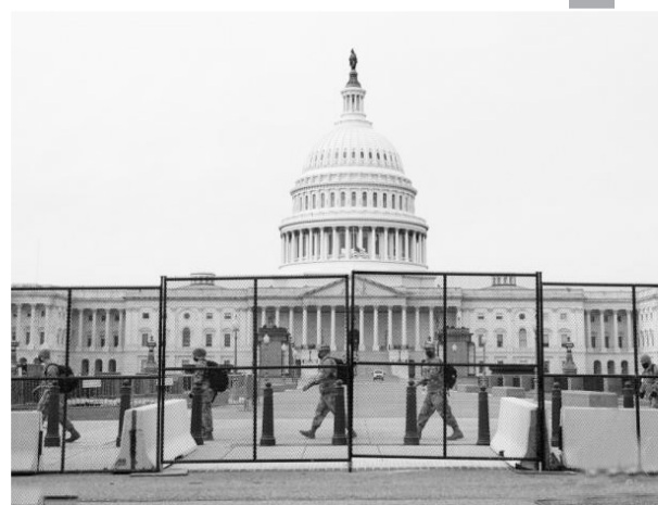
图为当地时间1月11日,美国首都华盛顿,国民警卫队成员抵达美国国会大厦

美国国会山骚乱事件发生后,定于1月20日举行的美国当选总统就职典礼的安全问题引发联邦和地方当局担忧。美国总统特朗普11日宣布,首都华盛顿特区进入紧急状态。 白宫声明说,紧急状态将持续至24日,并授权美国国土安全部和联邦紧急措施署“调动和提供必要设备和资源”,协调并帮助总统就职典礼前后的联邦和地方安保工作。 综合美国媒体报道,联邦调查局警告说,从16日至就职典礼前,全美50州首府和华盛顿特区可能发生武装抗议活动,美国国会和各州州议会可能是主要目标。 11日辞职的美国国土安全部代理部长沃尔夫表示,由于“安全形势不断演变”,他在辞职前数小时已下令将针对总统就职典礼的特别安保措施提前6天启动,即从19日提前至13日。 美国国民警卫队司令丹尼尔·霍坎森11日宣布,到16日,华盛顿特区将部署至少一万名国民警卫队队员。他表示,还可能向一些州增派5000名国民警卫队队员。 华盛顿市长缪里尔·鲍泽及毗邻华盛顿特区的弗吉尼亚和马里兰州州长11日发出呼吁,以6日国会山骚乱事件和持续肆虐的疫情为由,敦促民众不要参加总统就职典礼活动。 美国国家公园管理局当天宣布将华盛顿特区最高地标“华盛顿纪念碑”及其公共通道关闭至1月24日,“以应对针对游客和公园资源的具有可信度的威胁”,其间还可能临时关闭华盛顿市中心博物馆云集的“国家广场”相邻道路、停车场和洗手间。 1月6日,支持特朗普推翻2020年美国选举结果的示威者强行闯入美国国会大厦长达数小时,正在举行的认证大选结果的参众两院联席会议被迫中断,事件造成包括1名国会山警察在内的5人死亡。 据新华社