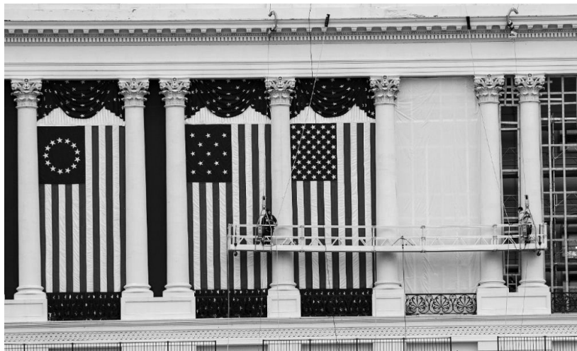
1月11日,在美国首都华盛顿,工作人员在国会大厦外悬挂旗帜,为下届总统的就职典礼做准备

“美国国会骚乱引发的社会震荡仍在持续,越来越多的美国大企业为维护自身形象,与部分共和党议员作切割。有的企业宣布暂停向他们提供政治捐款,更有激进的企业明确表示支持罢免即将卸任的总统唐纳德·特朗普。”