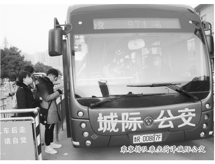
乘客排队乘坐菏泽城际公交

“我们目前主要针对菏泽及各县区的大中学校开展服务,并实行点对点的接送服务,将班车开进校园,让学生安全到达各县车站,减少场站周末乘客压力的同时,也为广大学生提供出行便利。”菏泽城际公交公司工作人员介绍说,定制包车服务深受学生