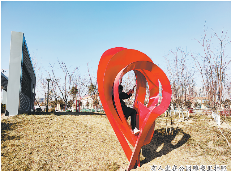
有人坐在公园雕塑里拍照