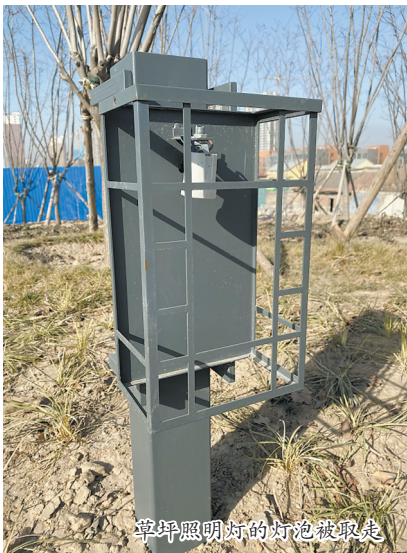
草坪照明灯的灯泡被取走