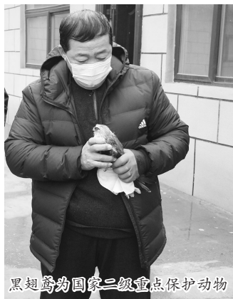
黑翅鸢为国家二级重点保护动物

洞,疑似弹弓所伤,再加上伤情严重,遂带上它来到兽医站寻求帮助。“经过手术,果然在它的体内取出了一枚钢珠,受伤的左翅也当场包扎好,这才终于有了点精神。”