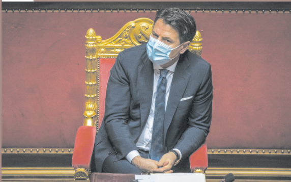
1月19日,在意大利罗马,意大利总理孔特出席参议院信任投票前的辩论。