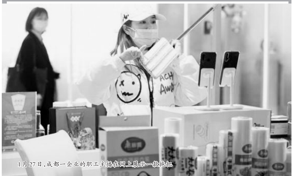
1月27日,成都一企业的职工主播在网上展示一款泡面

“就地过年”最近成了热门话题。在疫情防控新形势下,不少地区纷纷倡导就地过年。对一些“90后”和“00后”来说,在异乡过年还是头一回。 为了方便大家“淘年货”,商务部组织各电商平台举办了“2021年全国网上年货节”。这个特殊的春节,年轻人有哪些特别的过法?让我们从电商年货大数据里找找答案吧!