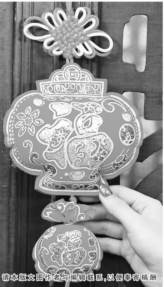
请本版文图作者与编辑联系,以便奉寄稿酬。