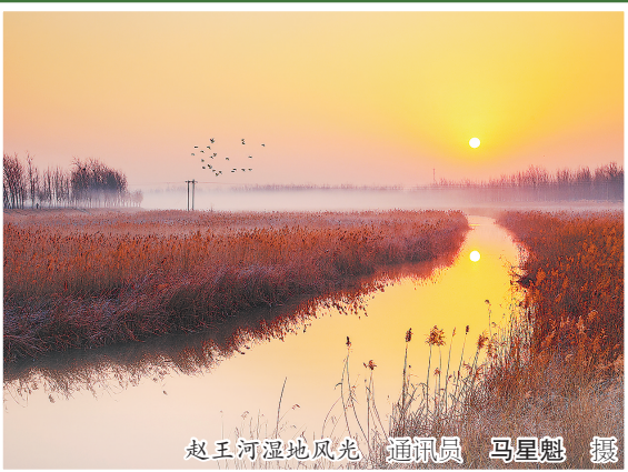
赵王河湿地风光