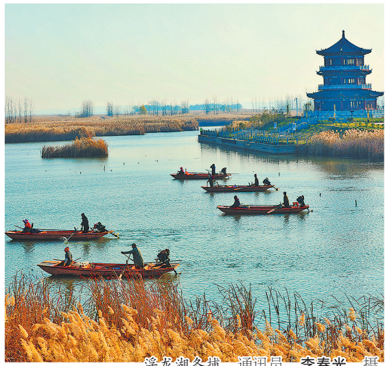
浮龙湖冬捕