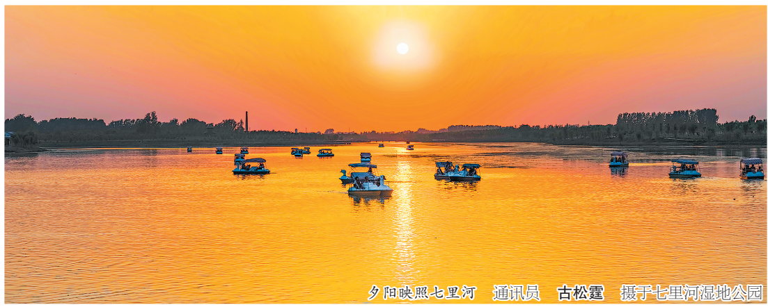
夕阳映照七里河 通讯员 古松霆 摄于七里河湿地公园