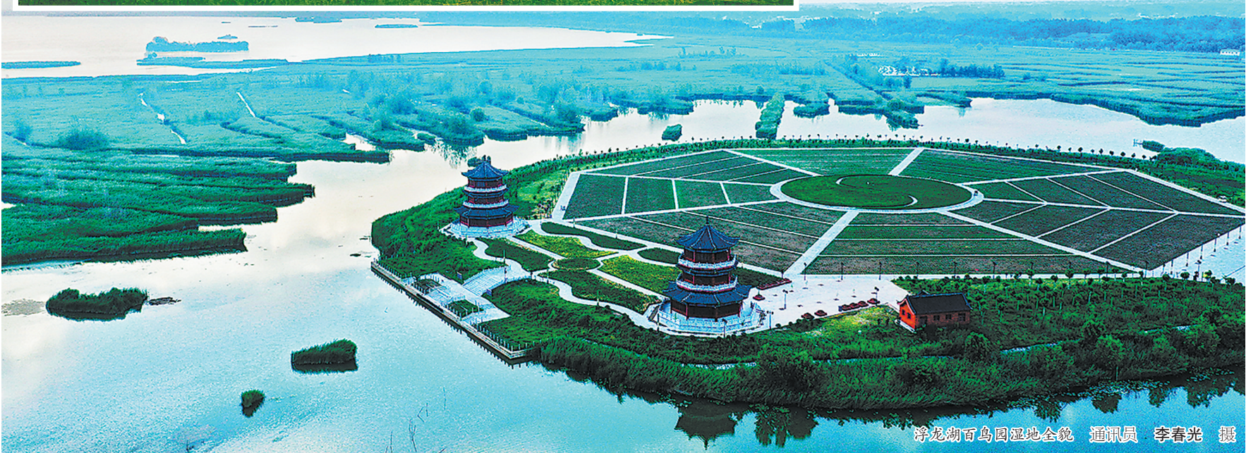
浮龙湖百鸟园湿地全貌