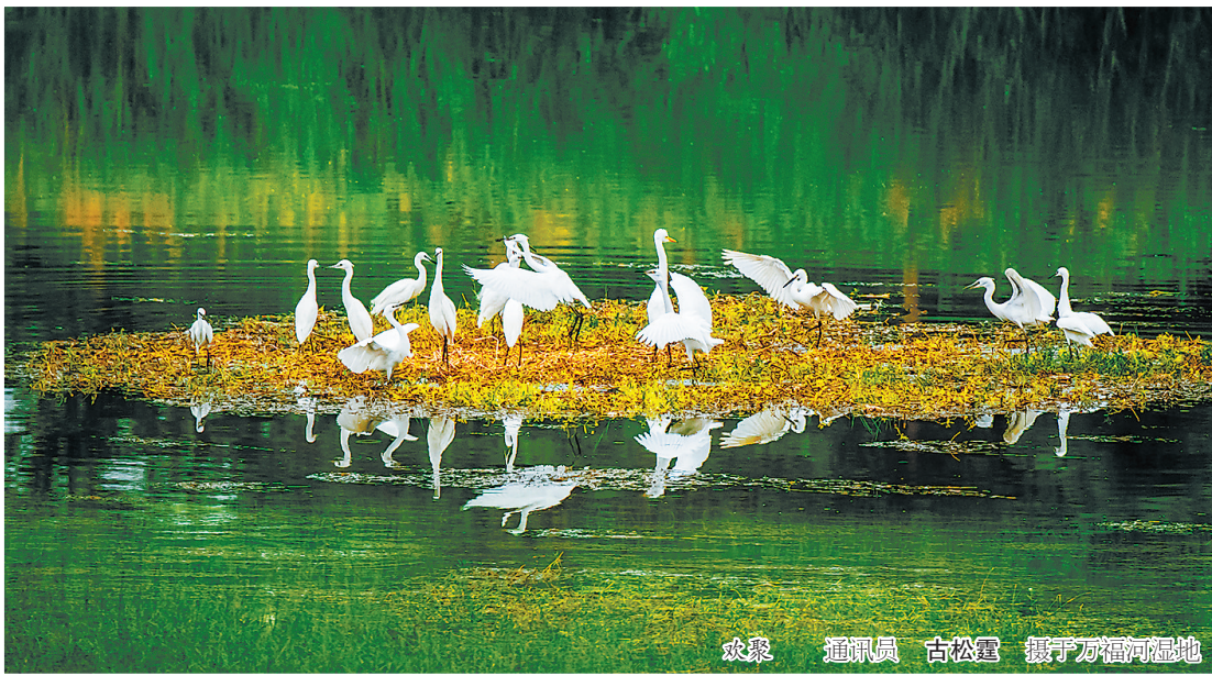
欢聚 通讯员 古松霆 摄于万福河湿地