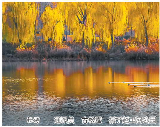
畅游于赵王河公园