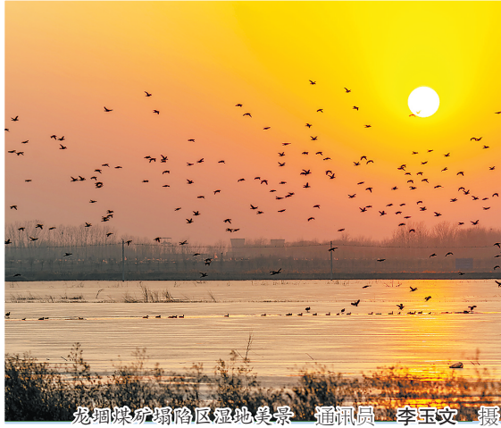
龙堽煤矿塌陷区湿地美景