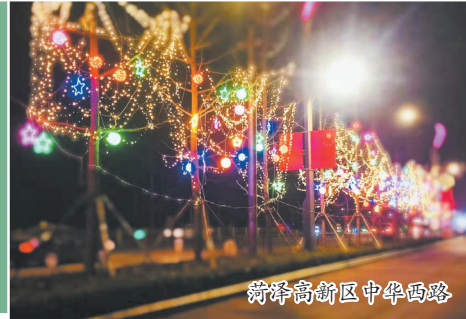
菏泽高新区中华西路