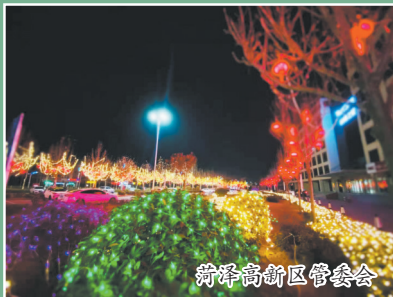
菏泽高新区管委会

按照“主要道路、广场为重点装饰区域,小巷等其他节点亮化为点缀”的思路,菏泽高新区正用简洁、喜庆的灯饰为百姓营造温馨祥和的节日氛围……一串串灯饰连接起来,透射着经济社会高质量发展的速度,蕴含着整座城市的温度,同时也预示着菏泽高新区群众,即将踏上牛年美好生活的道路!