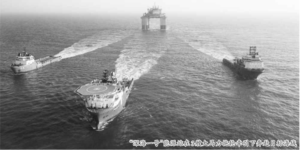
“深海一号”能源站在3艘大马力拖轮牵引下奔赴目标海域