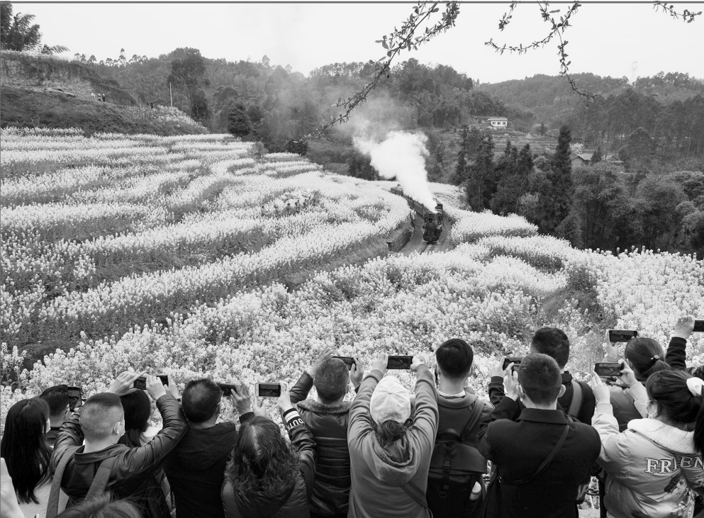
坐着小火车 穿越看花海 3月2日,一列嘉阳小火车经过段家湾蜜蜂岩的油菜花海。初春时节,四川省犍为县的嘉阳小火车迎来旅游旺季,众多游客慕名前来乘坐这列开往春天的“小火车”,沿途观赏风景,体验老式窄轨蒸汽火车的独特魅力。