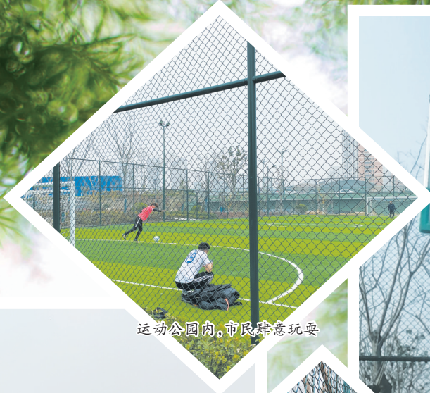
运动公园内,市民肆意玩耍

赵王河公园集文化、娱乐、休闲、旅游为一体,是菏泽市最具地方特色、现代气息和生态价值的一条重要景观带。近日,有读者反映,位于市双河路与天香路交叉口西北角运动公园里的体育设施屡遭人为破坏。3月15日,牡丹晚报全媒体记者来到该运动公园进行探访。