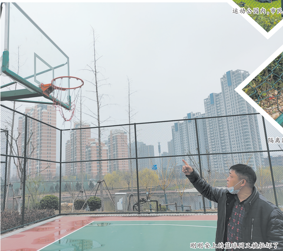
刚刚安上的篮球网又被扯坏了