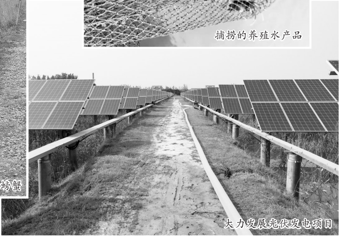
大力发展光伏发电项目