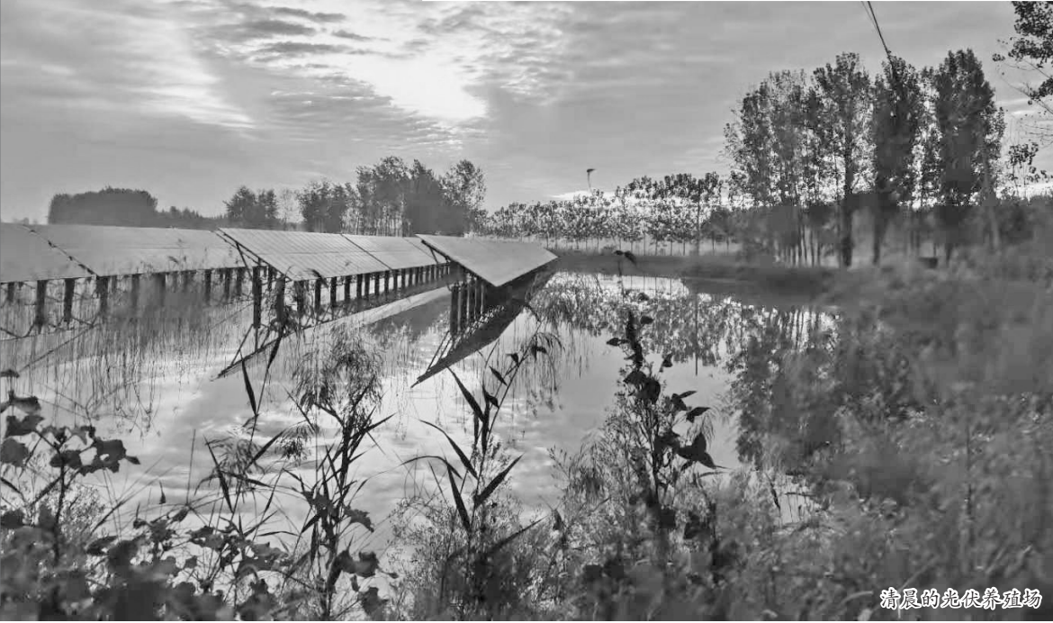
清晨的渔光互补养殖场