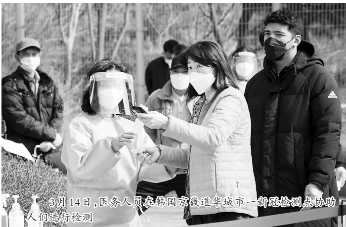
3月14日,医务人员在韩国京畿道华城市一新冠检测点协助人们进行检测

又到一年踏春季,韩国地方政府担忧人群扎堆影响新冠疫情防控,纷纷取消“杏花节”“樱花节”等大型赏花活动,还想出摇号赏花、交通限行等招数,敦促民众绷紧疫情防控这根弦。