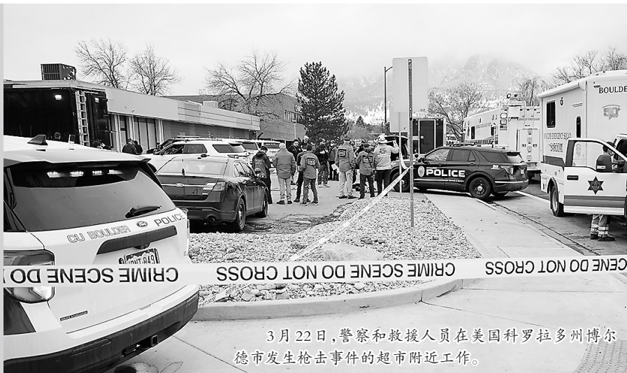
3月22日,警察和救援人员在美国科罗拉多州博尔德市发生枪击事件的超市附近工作。

美国警方22日说,科罗拉多州博尔德市一家超市当天下午发生大规模枪击事件,造成包括一名警察在内的10人死亡,一名嫌犯被抓获。