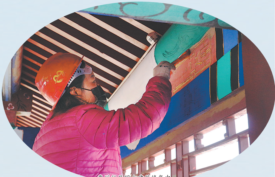
曹州牡丹园古建筑修复中