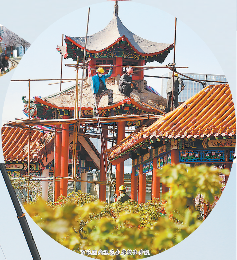
百花园内观花走廊整体升级