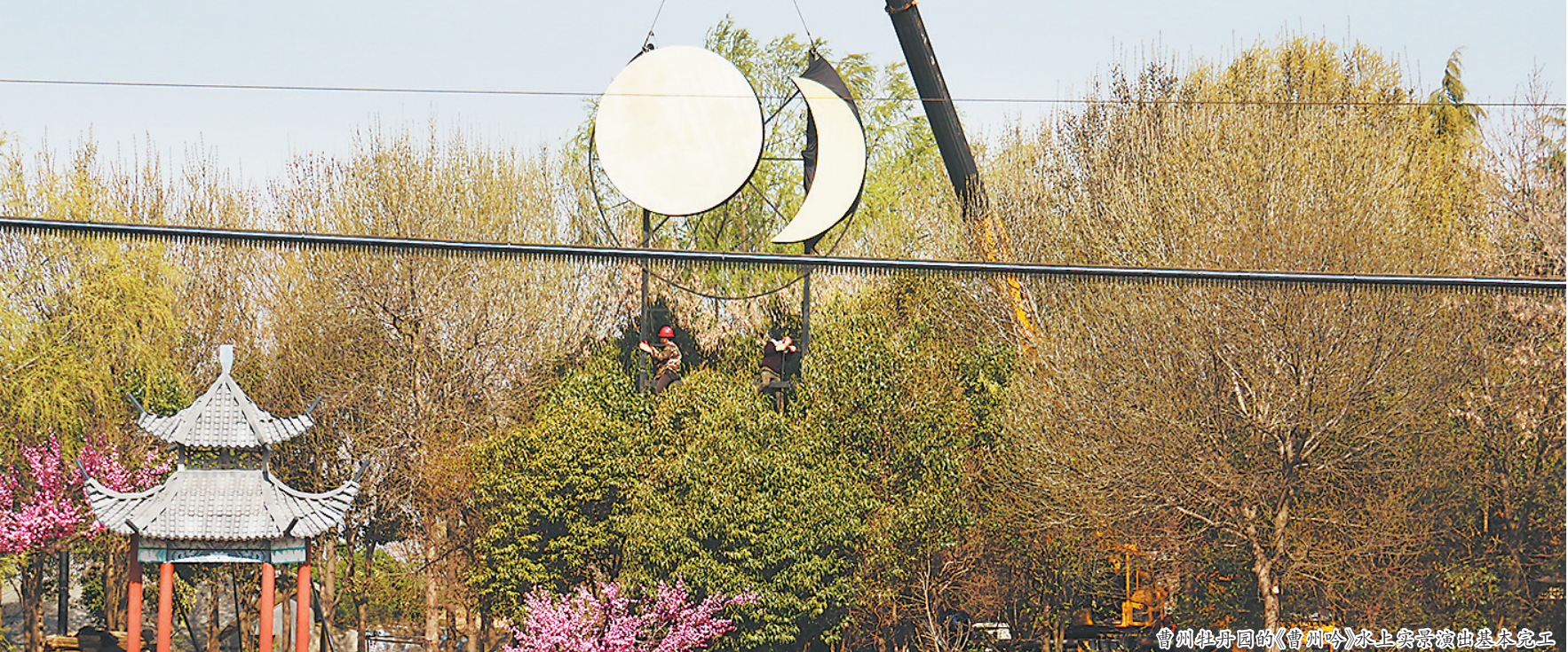
曹州牡丹园的《曹州吟》水上实景演出基本完工