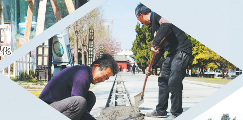
曹州牡丹园景区 游览小火车轨道 铺设基本完工