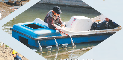
湖中喷泉最后复检