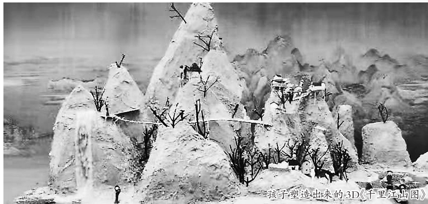
孩子塑造出来的3D《千里江山图》

记者了解到,“慢视界美术教育”秉承“创新、前沿”理念,打破传统单一架上绘画的展览形式,采用“学生体验、作品立体直观、社会参与”三位一体灵活多变的多种展览形式,在展览中不断拓宽材料、内容、主题与形式的表现空间,不仅让人耳目一新,还能调动所有观者积极参与其中,形成社会美育的良好效应。