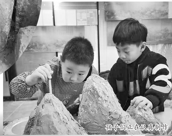
孩子们正在认真制作