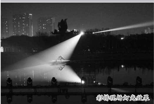
彩排现场灯光效果