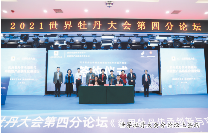
世界牡丹大会分论坛上签约

根等都有很高的药用价值,牡丹籽油更有着“植物脑黄金”之称。菏泽立足资源禀赋,逐渐趟出了一条以药用牡丹、观赏牡丹和油用牡丹为主的牡丹产业化发展之路。