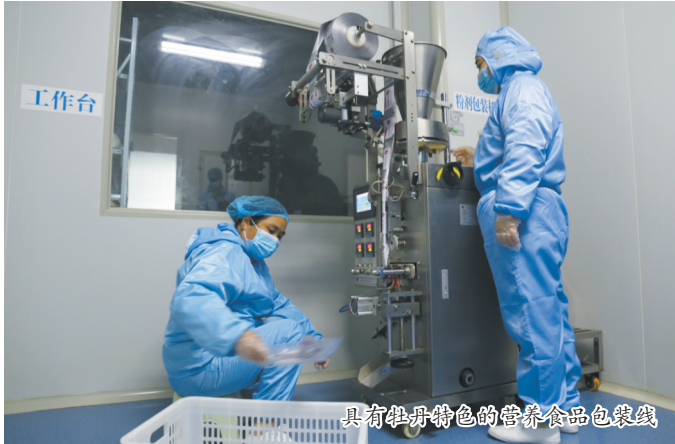
具有牡丹特色的营养食品包装线