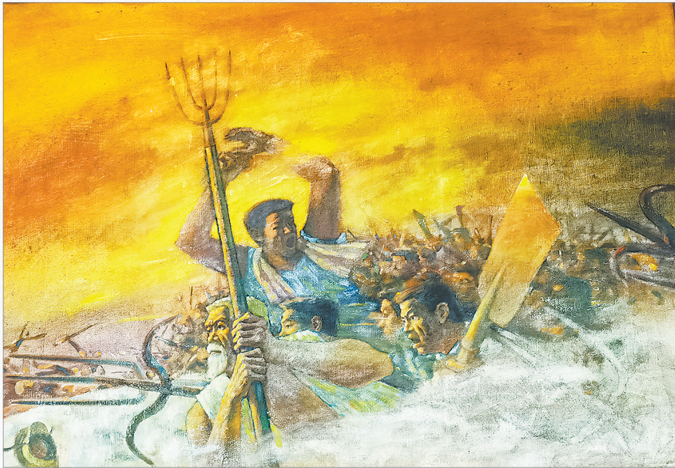
下图：东明盐民暴动油画。