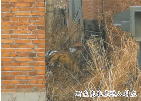
野生东北虎进入村庄