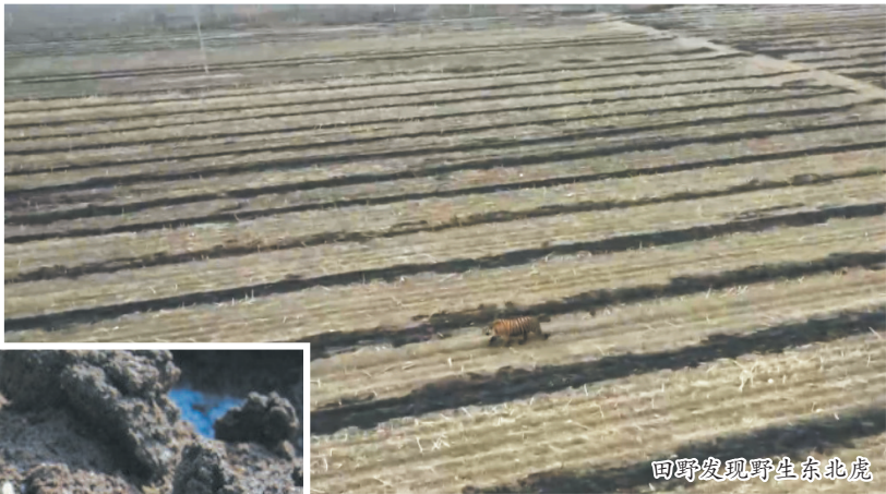
田野发现野生东北虎