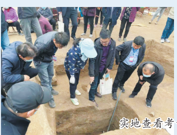
实地查看考古发掘现场