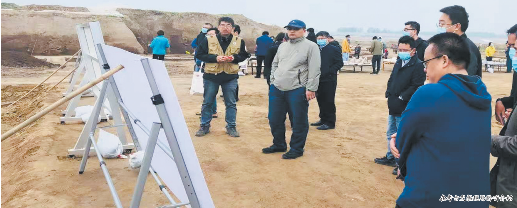
在考古发掘现场聆听介绍