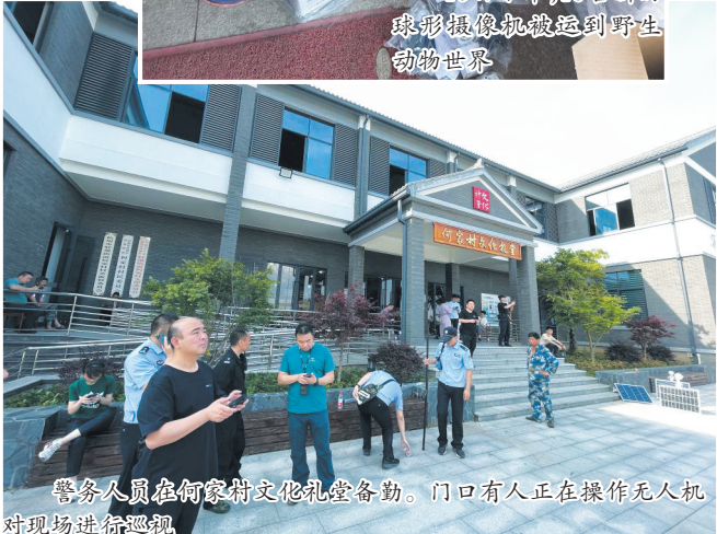
警务人员在何家村文化礼堂备勤。门口有人正在操作无人机对现场进行巡视