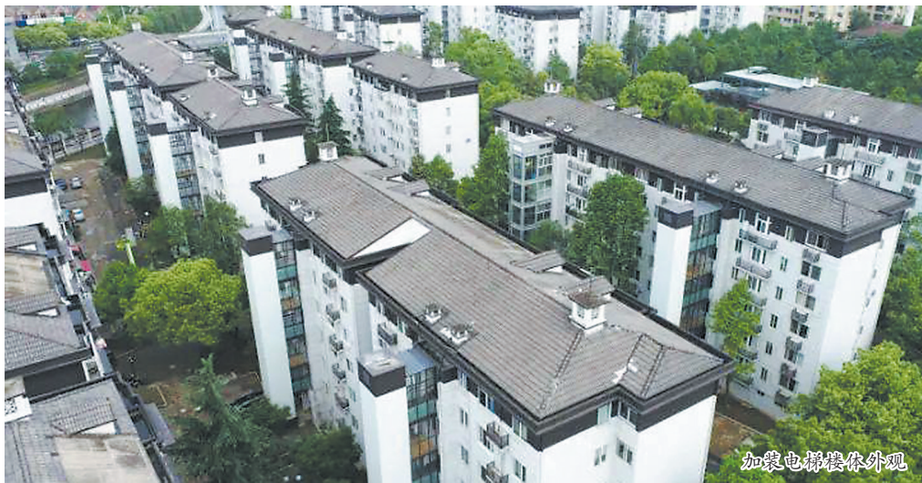
加装电梯楼体外观