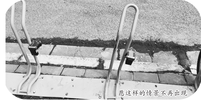
愿这样的情景不再出现

牡丹晚报全媒体记者走访发现,在市人民路、永昌路、和平路的小区及办公场所附近,站点内原本倾斜的车桩已经被逐一加固,损毁至无法使用的车桩也已经被替换。同时,因工作人员