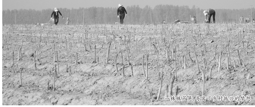
一株株芦笋,寄寓了乡村振兴的梦想