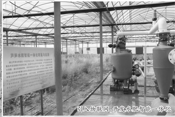
引入物联网,开发水肥智能一体化