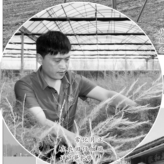
常化月正在农田仔细端详芦笋长势