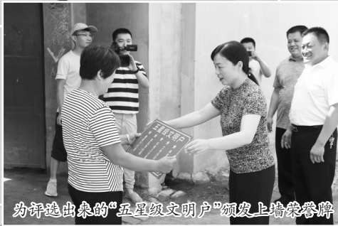
为评选出来的“五星级文明户”颁发上墙荣誉牌