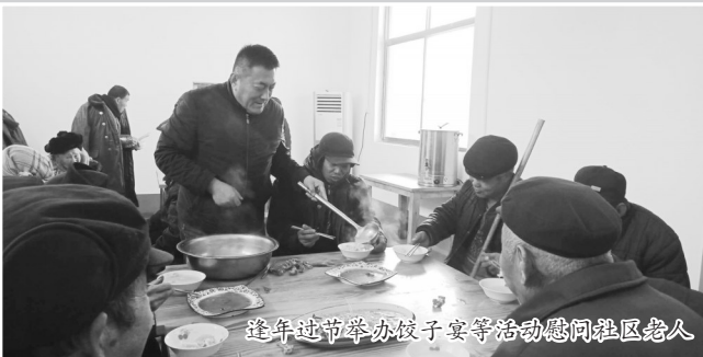
逢年过节举办饺子宴等活动慰问社区老人