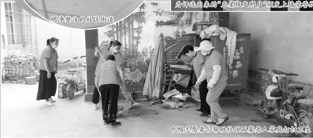
巾帼志愿者们帮助社区孤寡老人家庭打扫卫生