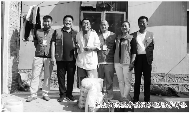
金太阳志愿者慰问社区弱势群体