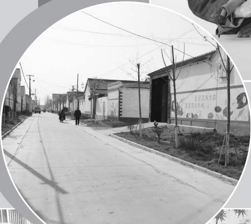
明净整洁的社区街道