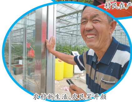
农村新生活,农民笑开颜