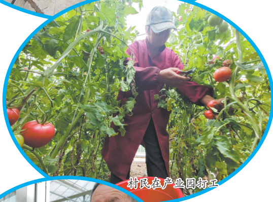
村民在产业园务工