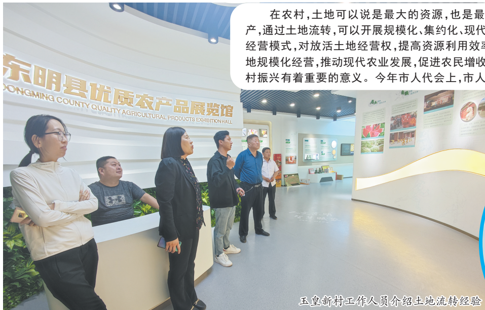
玉皇新村工作人员介绍土地流转经验