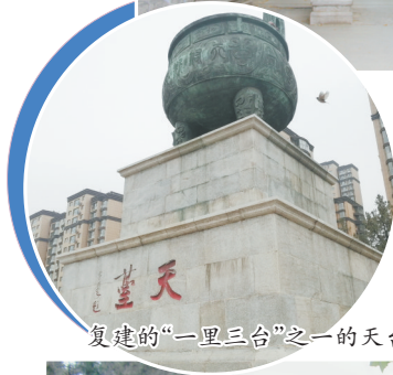
复建的“一里三台”之一的天台