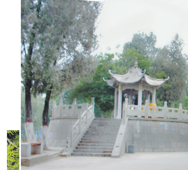
护城堤西南角的“梁王亭”