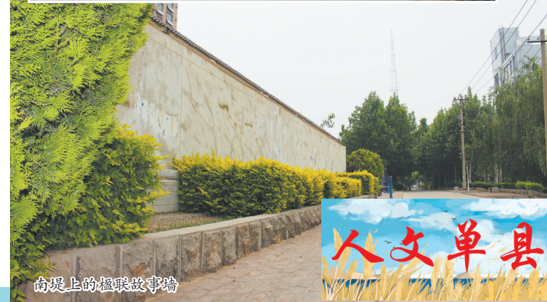
南堤上的楹联故事墙