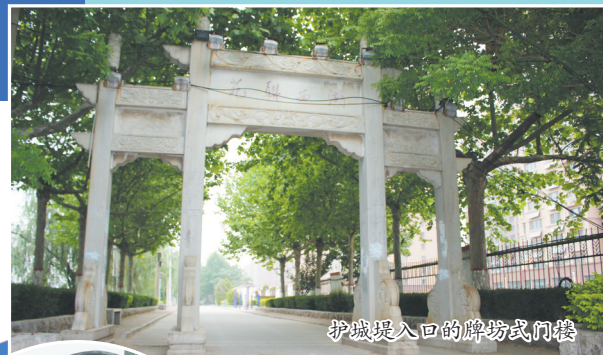
护城堤入口的牌坊式门楼