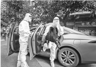
“一对一”专车将考生送到岭南画派纪念中学隔离考点

记者在金道中学看到,在出租专车的“一对一”服务下,考生们陆续来到现场。在考点入口处,考生首先要经过消毒人行通道,然后步行300米到达金道中学校门口。大多数考生都坐在事先准备的小椅子