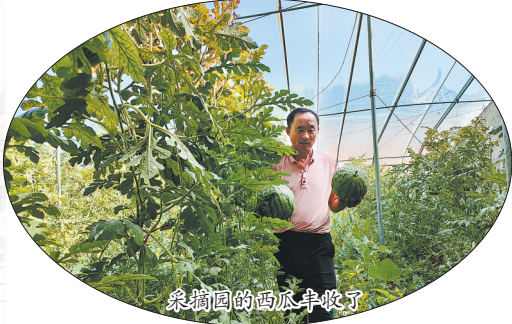
采摘园的西瓜丰收了