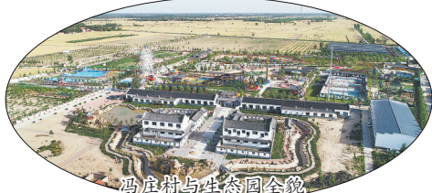
冯庄村与生态园全貌