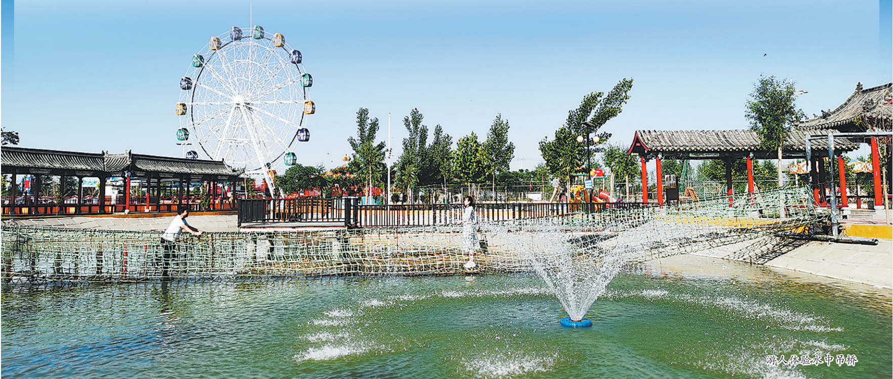
游人体验水中吊桥

“按照现下发展形势预估，村民们摆摊做生意平均一年纯挣4万元没问题，再加上打工，一年下来收益很可观。”冯红涛说，他们村发展目标清晰，就是依托生态园发展乡村游，逐步实现乡村美、产业新、农民乐、风尚好的乡村振兴新路子。