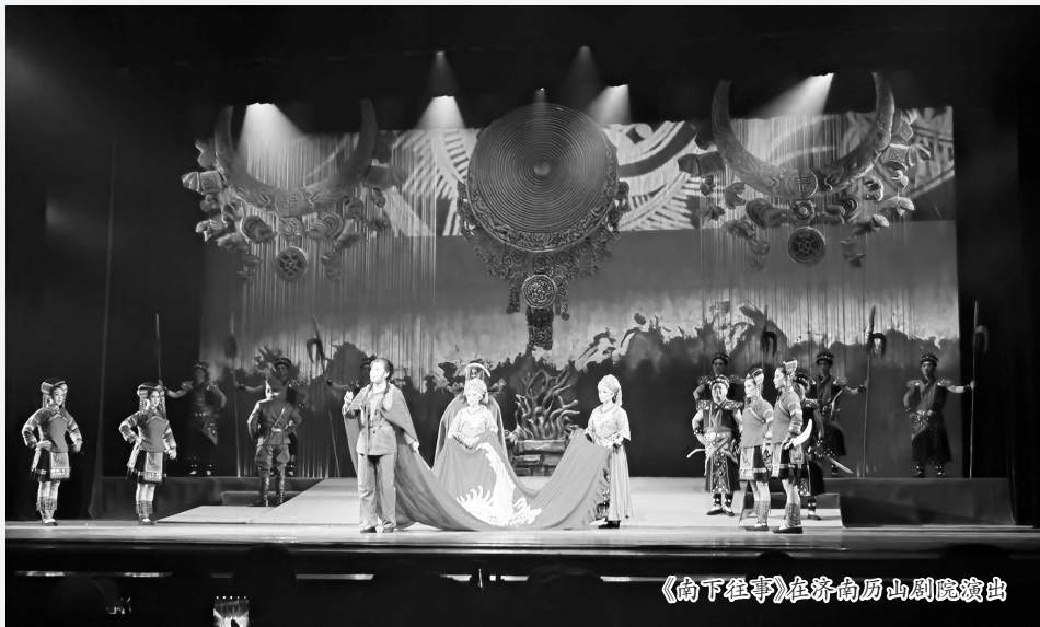
《南下往事》在济南历山剧院演出

本报讯 (牡丹晚报全媒体记者 文杰) 6月19日至20日,作为第十二届山东文化艺术节新创作优秀剧目评比展演的重点剧目,菏泽市地方戏曲传承研究院创作排演的山东梆子革命历史题材现代戏《南下往事》亮相济南历山剧院。