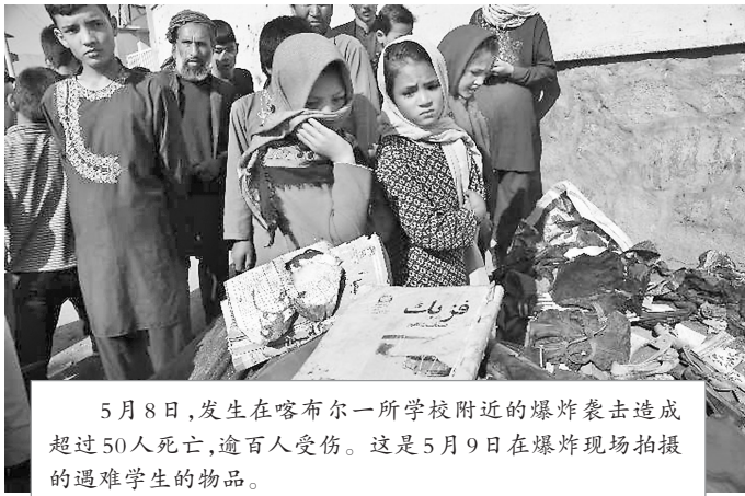
5 月 8 日,发生在喀布尔一所学校附近的爆炸袭击造成超过 50 人死亡,逾百人受伤。这是 5 月 9 日在爆炸现场拍摄的遇难学生的物品。

美国来到阿富汗自称是为打击极端主义,为这个饱受战争折磨的国家带来稳定,但结果在这两方面都失败了。“他们现在把我们留在何处?留在耻辱和灾难中。” 阿雷菲指出,美军撤离将进一步刺激当地极端组织大肆活动,这将给包括美国在内的多国带来安全威胁。 和谈前景渺茫 美国《华尔街日报》23 日援引美情报机构最新评估称,阿安全部队近期多次不战而降,让美军提供的不少装备落入塔利班之手。 也有分析认为,塔利班未必能在短期内控制整个阿富汗。美国智库兰德公司研究员贾森·坎贝尔表示,尽管塔利班近期在战场上获得进展,但有证据表明,至少有一部分攻势是为了宣传,且阿安全部队在部分地区击退了塔利班的进攻。加尼 25 日也表示,阿安全部队当天已从塔利班手中夺回 6 个地区。 朱永彪认为,未来一段时间