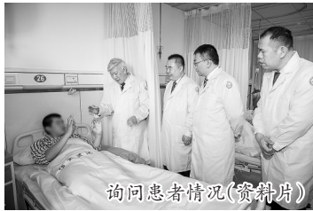
询问患者情况(资料片)