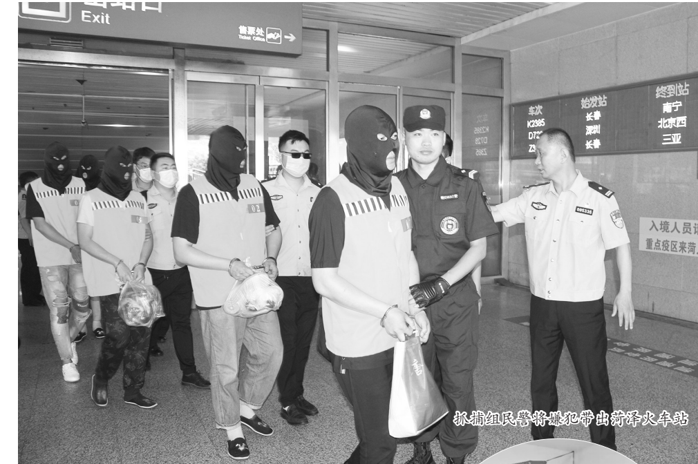
抓捕组民警将嫌犯带出菏泽火车站

等人组织大巴车,将这些人员带至天津市,注册成立公司,每家公司均在金融机构开设了公司账户,石某等人再以每套手续1000元至20000元不等的价格出售给多地从事网络诈骗、网络赌博的多个犯罪团伙,实施违法犯罪活动。警方经过梳理,该团伙组织的人员共成立了3000多家公司,开设16000多个公司账户,最多