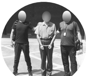
外出抓捕期间,民警将嫌犯带进当地看守所

监管部门的协助下,办案民警围绕涉案企业的法定代表人进行梳理,发现这些企业的法定代表人名下有多家公司,围绕这些公司股东展开调查,民警又梳理出400多家公司与案件有着千丝万缕的联系。