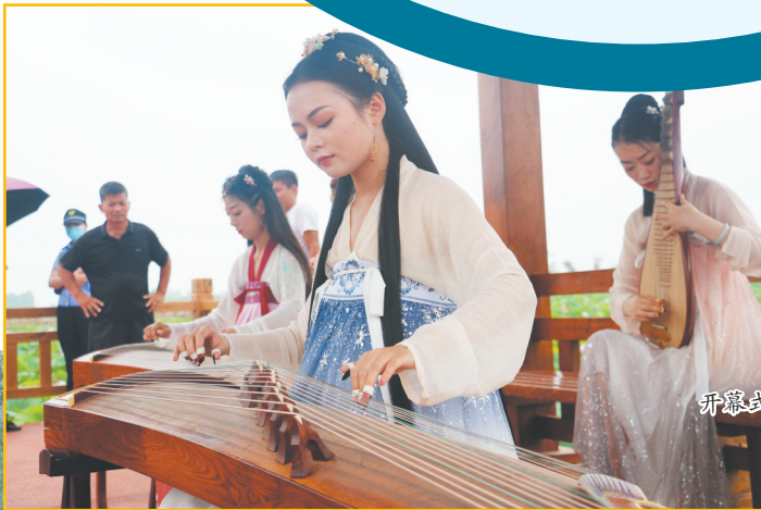
开幕式上的文艺演出