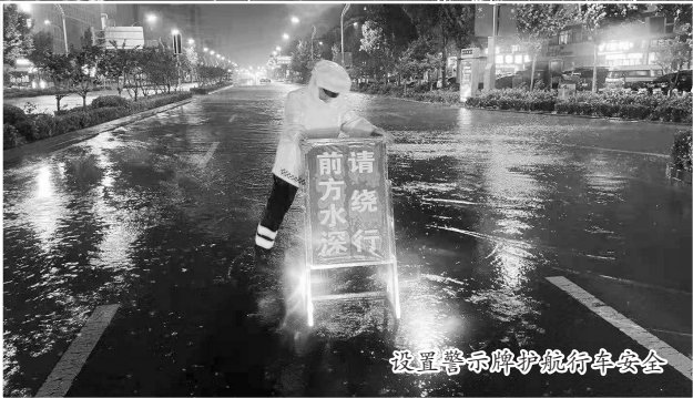
设置警示牌护航行车安全