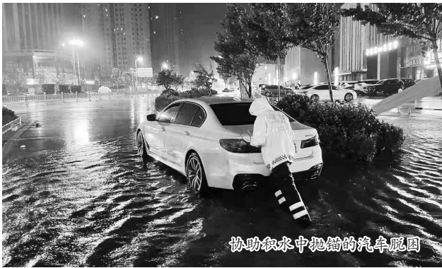
协助积水中抛锚的汽车脱困