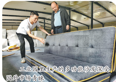
工业园里生产的多功能沙发深受国外市场青睐

公司、产业化民营企业,品种也从当初的单一品种拉菲草发展到如今的拉菲草、玛瑙原石、红木、蓝湿牛皮及丁香五类系列品种。