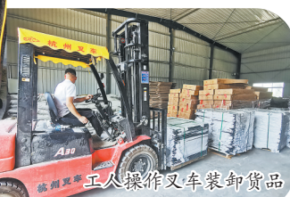
工人操作叉车装卸货品