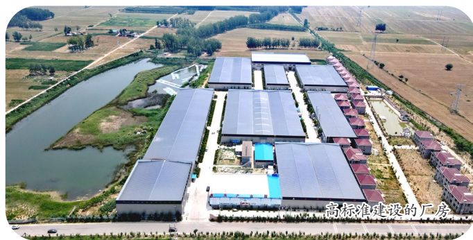
高标准建设的厂房

现在,卢寨村通过园区发展,把园区生产的一部分工艺品和户外家具远销马达加斯加、欧美等国家和地区,深受当地市场青睐。截至目前,在马达加斯加从事进出口贸易的卢寨村人有40余人,人均年收入达16万元左右。