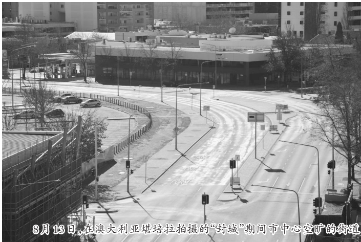
8月13日,在澳大利亚堪培拉拍摄的“封城”期间市中心空旷的街道

澳大利亚政府官员14日说,人口最多的新南威尔士州乃至整个国家正处于新冠疫情暴发以来“最糟状况”。为确保悉尼等地“封城”顺利实施,警方将对违反相关规定者处以最高5000澳元(约合2.4万人民币)罚款。