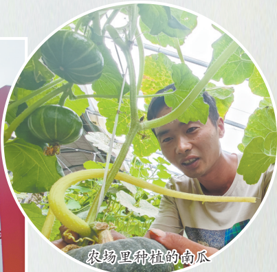
农场里种植的南瓜