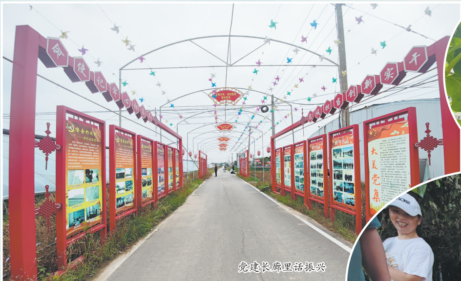
党建长廊里话振兴

胡楼村位于成武县党集镇西南部,有着远近闻名的艾克尔农场,农场里不仅有各种水果,还有各式蔬菜。 近年来,该村紧紧围绕“抓党建、兴产业、强基础、谋振兴”的工作思路,努力实现产业兴旺、生态宜居、乡风文明、治理有效、生活富裕,先后被评为“省级文明村、菏泽市优秀服务型村级党组织”。8月18日,牡丹晚报全媒体记者走进成武县党集镇胡楼村党群服务中心,看到一面面奖牌熠熠生辉,它们仿佛向人们诉说着近年来胡楼村村民在村党支部成员带领下,精诚团结、奋力脱贫攻坚、共建美丽宜居乡村的振奋人心的故事。