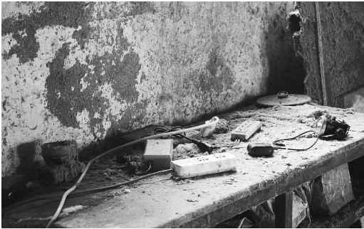
▲ 电线杂乱不堪 ▼ 火灾隐患大排查

本报讯 (牡丹晚报全媒体记者 艳粉) 9月7日,牡丹晚报全媒体记者从巨野消防救援大队获悉,在组织开展火灾隐患大排查大整治活动中,该大队依法将一存在火灾隐患的纺织厂临时查封。 活动中,巨野消防救援大队检查人员来到鲁智纺织有限公司,看到该纺织厂内生产加工环境让人触目惊心:四处可见裸露的杂乱电线,电线下方堆积着大量可燃物,并将疏散通道堵塞。检查人员在检查厂区内消防设备时还发现:灭火器损坏过期、应急疏散、安全出口指示标示损坏等问题,厂内消防管理状况堪忧。 此外,该厂区储存仓库全部使用泡沫彩钢板搭建的储存大量可燃物,并没有消防设施和设备,存在很大的消防安全隐患。 针对该厂区存在的火灾隐患,检查人员依法对该纺织厂进行临时查封督促整改,对拒不整改的将强制执行。