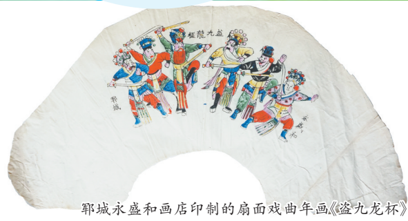
郓城永盛和画店印制的扇面戏曲年画《盗九龙杯》