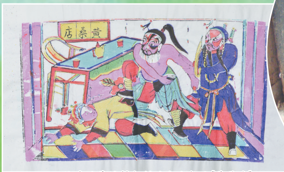
郓城县戴垓村印制的戏曲年画《黄桑店》

在历史上,郓城县的木版年画曾有过较为广泛的制作区,其画店与作坊林立,可以说是目前考察可见曹州木版年画堂号与店铺最多的一处县域。不过在以往文献记载与学术研究中,对此地的探究相对较少,多为论文或文章中的只言片语,其全貌较难呈现。笔者自2017年10月第一次展开曹州木版年画寻访时,便带着“源盛永画店身在何处?”的问题,有文献称其位于郓城县的杨寺村,所以关于郓城木版年画的考察就此展开。针对几年来所搜集文献、图像、考察、口述等资料的汇集,可以简单谈一谈我所了解的郓城木版年画。