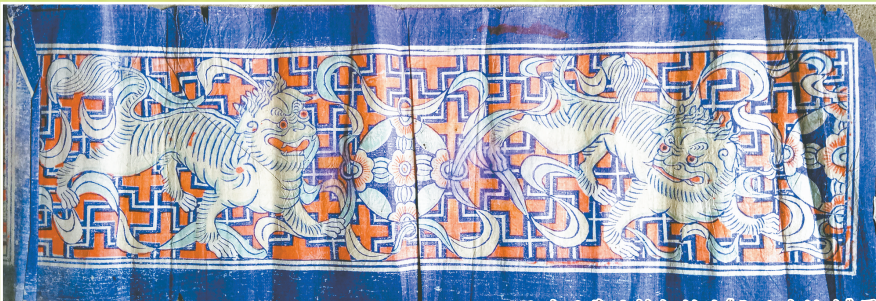
郓城县戴垓村印制的《狮子滚绣球》罩方画

可以看到,相对菏泽其他县域,郓城县年画生产历史悠久且画店众多,其生产类别基本涵盖了曹州木版年画的所有大类,并且水浒纸牌、罩方画等生产均水平较高,显示出成熟的刻印技巧与完整的师徒传承谱系。本文所提画店或作坊信息仅为个人考察所得,可为一点文化的引子,其后的研究仍然需要在这些文化信息的指引下更为深入且立体地呈现。同时,这些信息与历史也将是县域非遗保护工作中可供参考的资料,今列举至此,望于个人及政府均有所用、有所思。