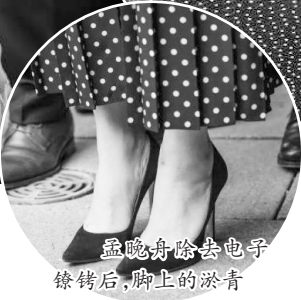
孟晚舟除去电子镣铐后,脚上的淤青