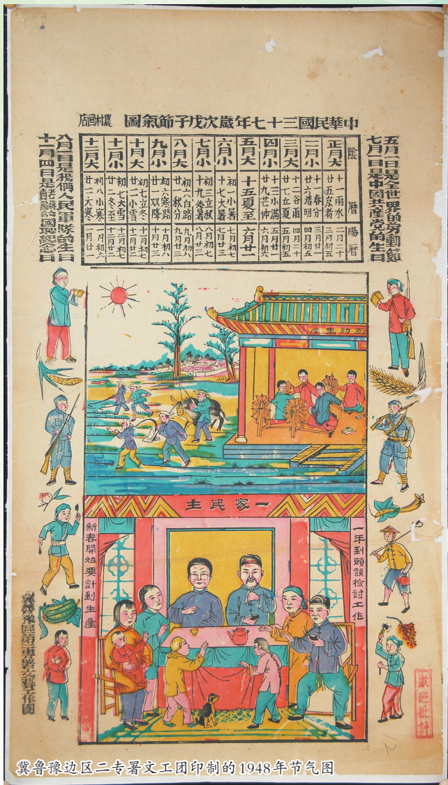
冀鲁豫边区二专署文工团印制的1948年节气图