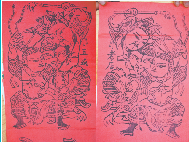
玉盛老店印制的对金抓门神