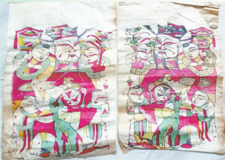
同盛老店印制的五子登科门神