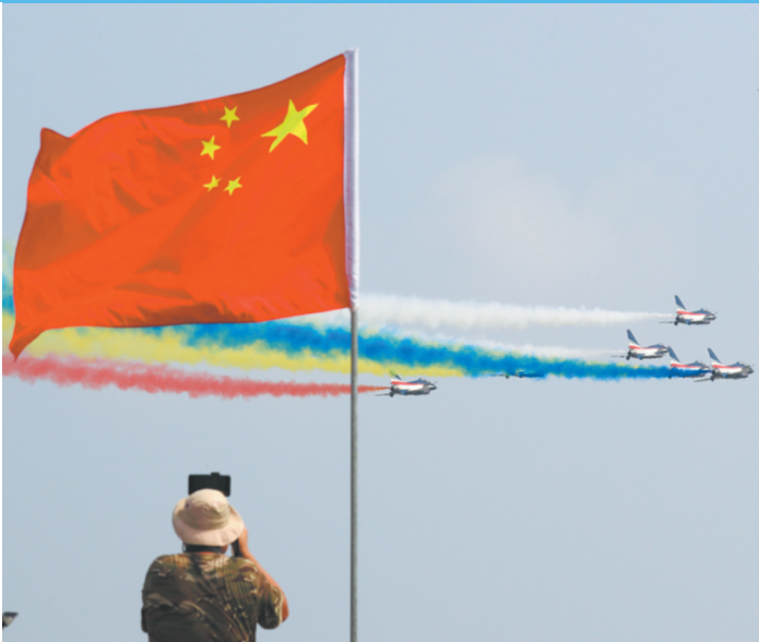
9月28日,中国空军航空大学“红鹰”飞行表演队在第十三届中国国际航空航天博览会开幕式上进行飞行表演。