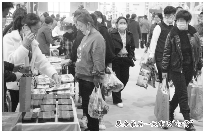
展会最后一天市民“扫货”

会上吸引力最大的要数食品了。本届林交会设有森林食品展区,观众转上一圈可以买到各地的森林食品,堪称“一站式购物平台”。