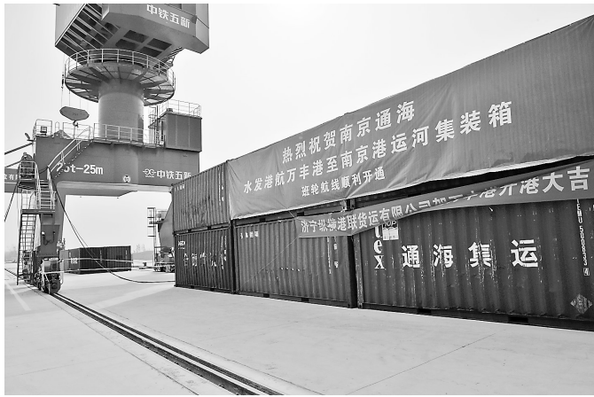
万丰港首批班轮航线开通