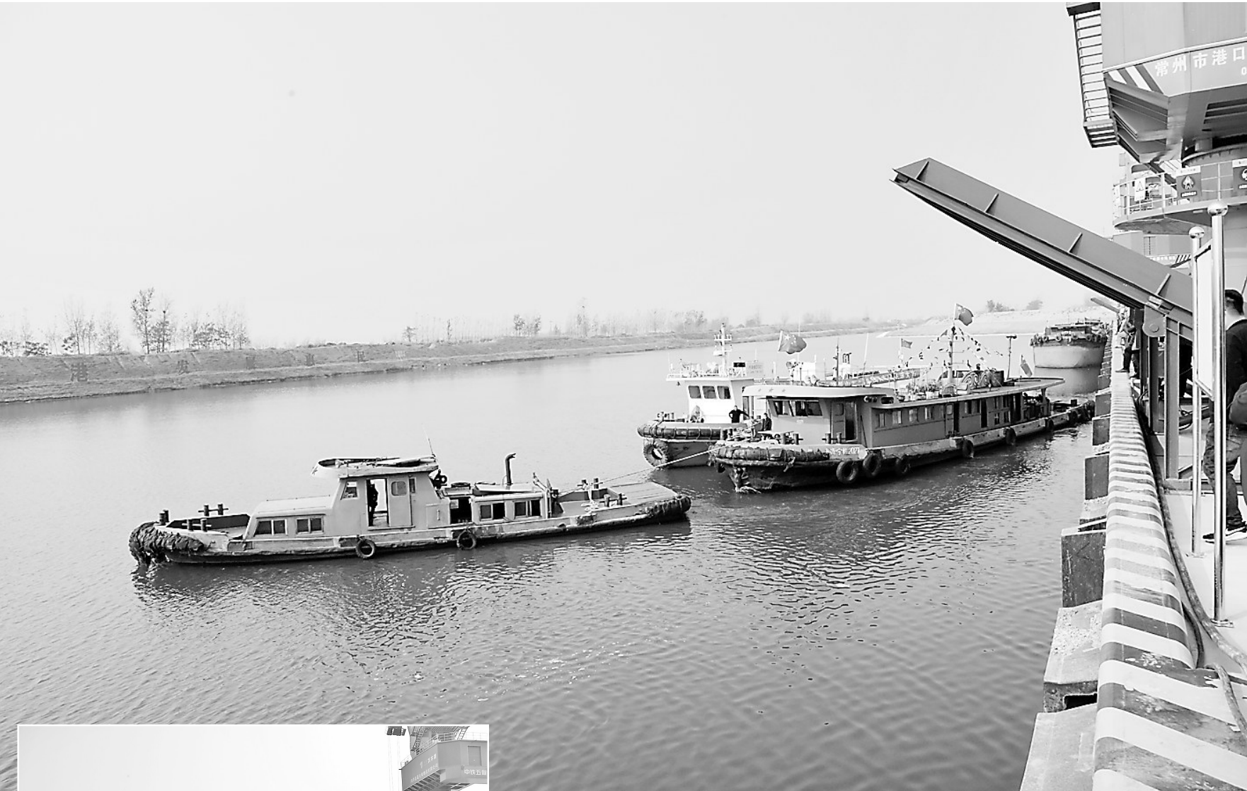
新万福河航道万丰港迎来首批货轮

应急演练过程中发现的问题和短板,坚持问题导向,抓好整改提升,切实解决疫情应急处置中需要细化实化具体化的问题。要扩大演练范围,增加演练频次,开展多种形式的演练,全面提高疫情处置协调能力,达到检验预案、完善准备、堵塞漏洞、加固防线的目的,确保各项防控措施落实到位。