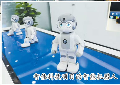
智佳科技项目的智能机器人