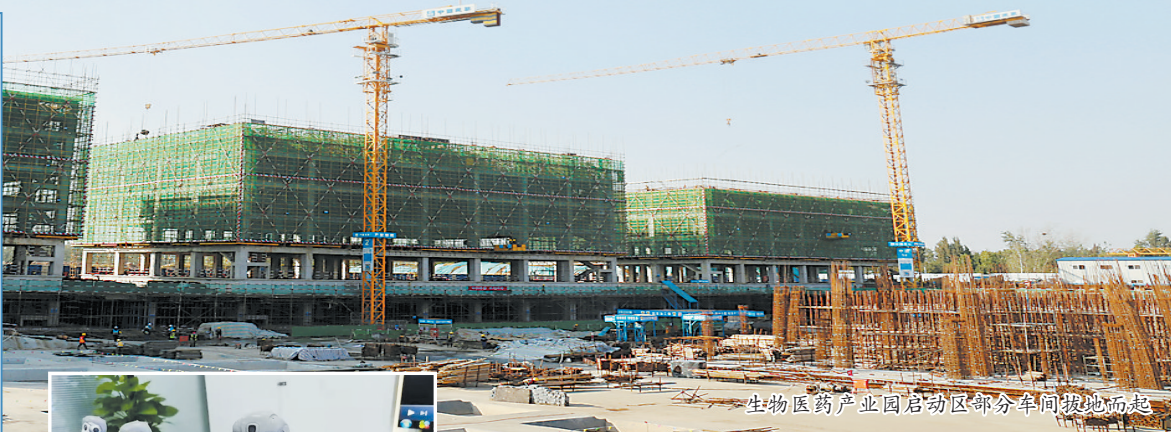
生物医药产业园启动区部分车间拔地而起

以智能制造为核心的了未来大健康智慧产业化集采项目,促进生物医药产业规模化、集约化发展的生物医药产业园,凸显人工智能的智佳科技,汇集科技创新成果的菏泽双创街,以项目建设跑出“菏泽速度”的万通医药健康产业园……一个个重点项目建设全力推进,一批批新兴产业崛起发力,让全市经济社会发展现场观摩团目睹了高新区项目建设竞相发展的喜人景象,感受到了高新区抓项目、兴产业、促发展的火热劲头和经济发展的滚滚热潮。