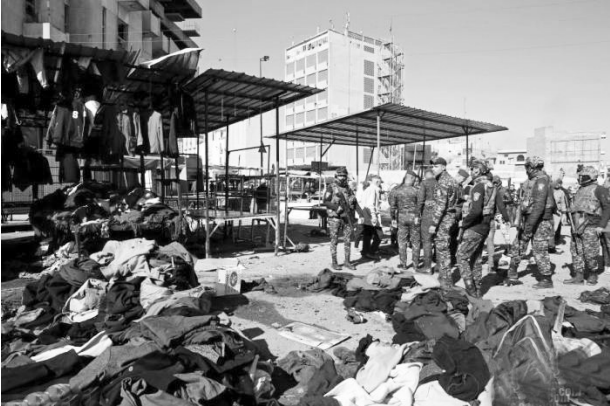
当地时间1月21日,伊拉克巴格达市中心发生自杀式爆炸袭击。据报道,爆炸袭击已造成28人死亡,73人受伤。图为爆炸现场。

伊拉克军方7日说,伊总理卡迪米位于巴格达“绿区”内的住所当日遭无人机袭击,卡迪米躲过袭击未受伤害。 伊拉克联合行动指挥部发表声明说,当日凌晨4时许,一架来历不明的无人机向卡迪米位于“绿区”内的住所投掷炸弹,但卡迪米毫发无伤地躲过了袭击。伊拉克安全部队已采取必要措施应对袭击事件。 从社交媒体流传的现场图片看,爆炸使卡迪米住所的门窗受到轻微损坏,但建筑主体结构未遭到破坏。 袭击事件发生后,卡迪米在社交媒体上发文说:“我很好……我呼吁所有人保持冷静和自我克制,袭击事件不会