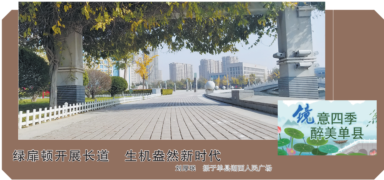
绿庠顿开展长道 生机盎然新时代 刘厚珉 摄于单县湖西人民广场

本报讯(通讯员 刘厚珉)日前,中国·单县首届“湖西杯”创新创业大赛在济南启动,山东产业技术研究院院长孙殿义,单县县委副书记、县长魏传永,启迪控股高级副总裁、山东产研启迪孵化器董事长王永瑞出席启动仪式并讲话。 单县作为鲁苏豫皖四省通衢之地,区位优势和资源配比有着巨大的发展潜力,山东产研院集中资源成立湖西分院,全力助推单县科技创新和经济社会快速发展。 孙殿义表示,湖西分院要在单县县委、县政府及启迪之星等有关单位的支持指导下,真正将此次创新创业大赛办好、办成、办出特色。要立足单县当地材料、农业、健康等重点产业特点,充分发挥科技的力量,解决每一个具体 问题,为单县高质量发展作出贡献。 魏传永表示,单县将进一步优化营商环境,为大赛项目落地转化提供全方位、一站式服务,助力优秀项目落地生根、开花结果。 王永瑞表示,启迪将充分发挥孵化网络优势,助力单县大赛广泛吸引海内外高层次人才带资金、带创意、带技术落户单县创办企业,启迪也将为参赛项目和团队搭建起展示交流、创业培训、入园孵化、资本对接等要素富集的广阔平台,促进人才、技术、资金等创新要素加速汇聚,推动单县开放创新迈上新高度。 据悉,本次大赛以“以赛引才”为目标,结合单县主导产业发展,聚焦生命大健康、高端化工新材料、现代高效农业产业方向,设置3个领域赛道,采取线上线下相结合的方式,针对大赛项目征集、报名、复审、初赛和决赛等环节,开通线上运行平台。大赛将进一步加强单县与海内外专家、项目高起点、多领域、全方位科技合作,促进更多科技成果在单县落地转化,构建完善的创新创业生态体系,推动主导产业高质量发展。