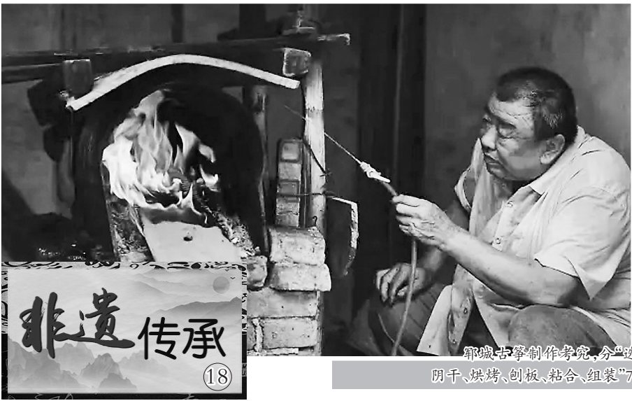
郓城古筝制作考究,分“选材、剖解、阴干、烘烤、刨板、粘合、组装”7道流程